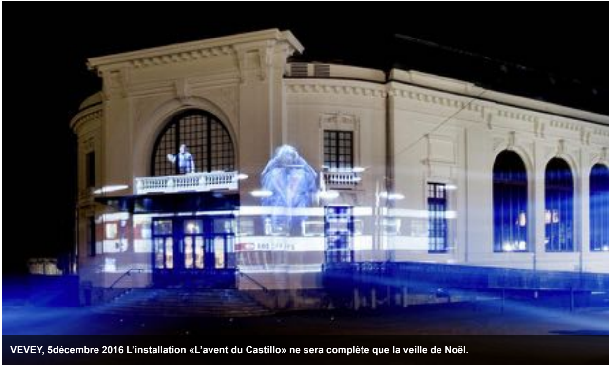
VEVEY, 5décembre 2016 L'installation «L'avent du Castillo» ne sera complète que la veille de Noël.